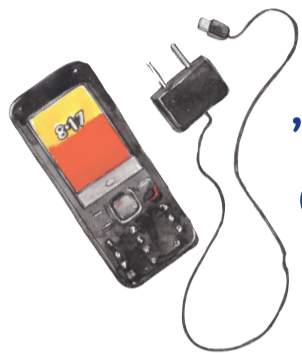
'n Selffoon en laaier