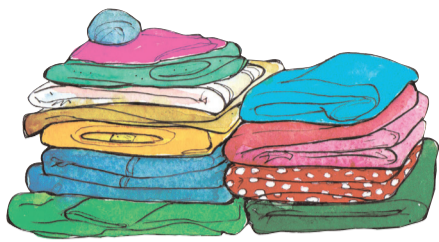
Klere en nagklere

Dis amper soos om vir 'n tydjie iewers heen te gaan.