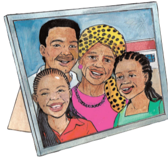
Iets wat jou aan jou geliefdes herinner bv. foto van die familie

Boeke, tydskrifte of kunsvlyt (bv. brei, naaldwerk, houtsneekuns)