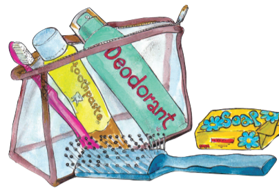
Tandeborsel, tandepasta en ander toiletware